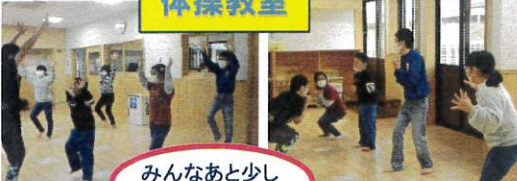
みんなあと少し ガンバレ♡