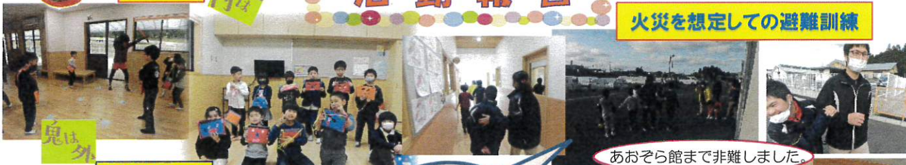
あおぞら館まで非難しました。