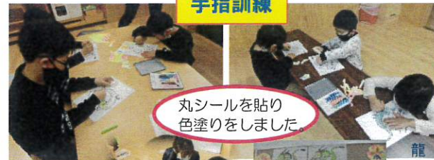
丸シールを貼り 色塗りをしました。