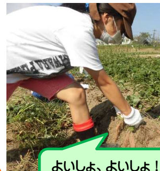
よいしょ、よいしょ！ あともう少し！