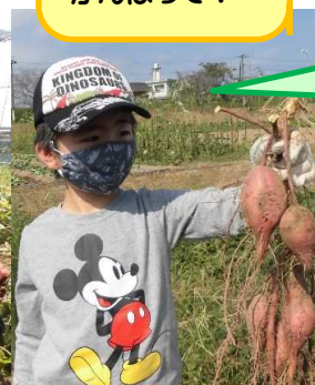
いっぱいお芋が 取れたよ！