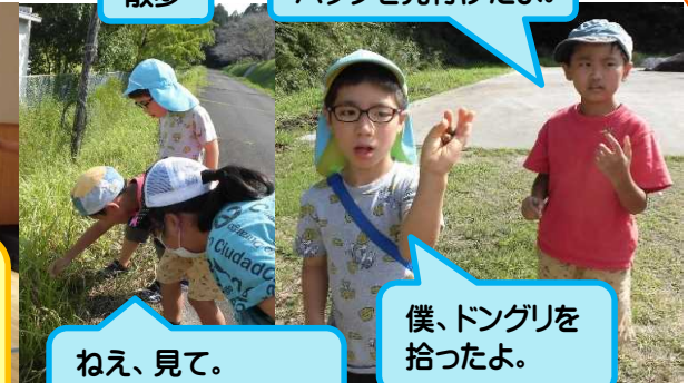
ねえ、見て。 ここに、何かいるよ。